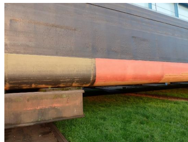
Oberhalb der AMC Beschichtung bisheriges Antifouling