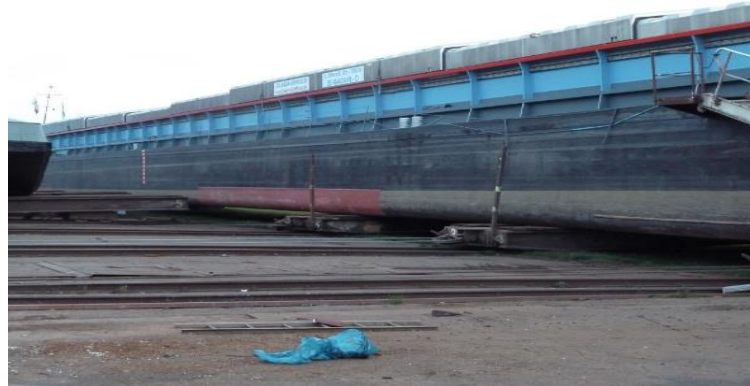
Teilweise beschichtet zu Testzwecken