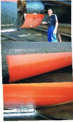
Beschichtung mit AMC