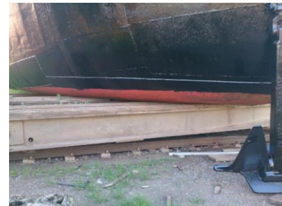
Nach 2 Monaten wegen Reparatur aus dem Wasser auf's Dock. Schwarzer Anstrich = mit leichten Algenbewuchs