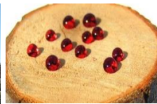
Rotwein auf Holz