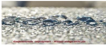
Wasser dringt nicht ein