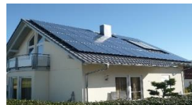
Fassade / Dach