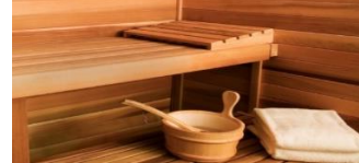
Freizeit / Sauna

Die Beschichtungstechnologie, die wir Ihnen hier vorstellen, ist eine wirklich außergewöhnliche Technologie – High Tech Made in Germany.